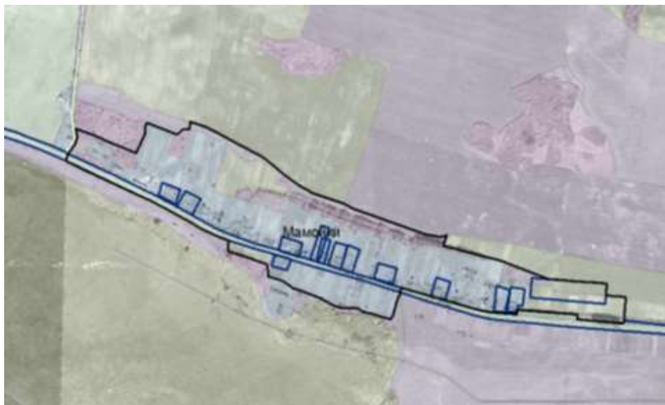
граница деревни Мамойки Бешенковичского сельсовета до изменения