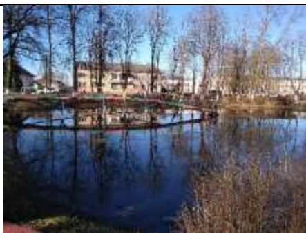
Фрагменты парка з двума вадаёмамі