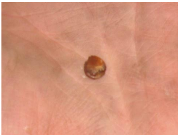
Буриштынавыя пацеркі. Асавец-2