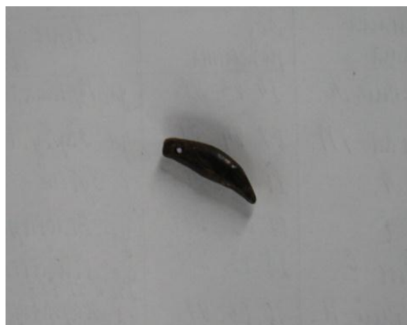
Свідраваны зуб для падвескі.