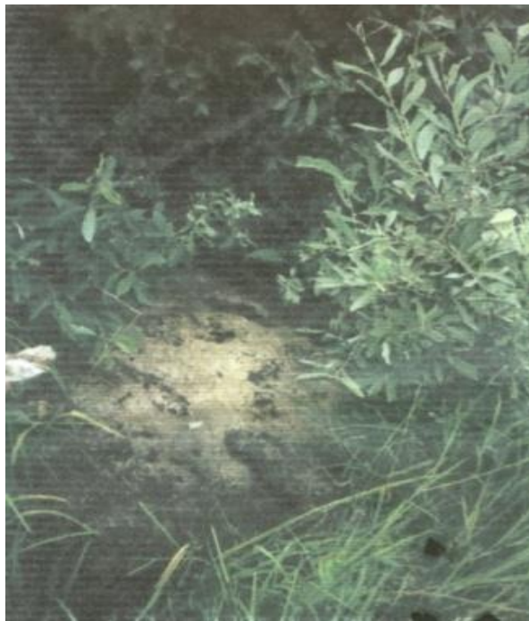
Камень следавік каля вёскі Астроўна.

Гэтую назвуносяць камяні, якія маюць на сваёй паверхні паглыбленні падобныя на след чалавека, або жывёлы. У паглыбленняў розная форма: адбітак босай нагі, чаравіка, далоні, лап і капытаў розных звяроў. Звычайна след на валунах адзінкавы, але бывае па два, тры адбіткі адразу. Як правіла сляды маюць натуральныя памеры, але сустракаюцца і маленькія, і сляды-веліканы. Паглыбленні на валунах бываюць натуральныя, якія ўзніклі ў выніку выветрывання. Бываюць зробленыя рукамі чалавека. Амаль кожны следавік мае імя. Сляды часта прымалі за