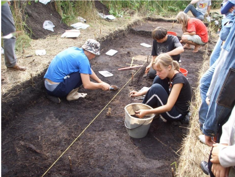
Археалагічныя раскопкі на паселішчы Асавец-7